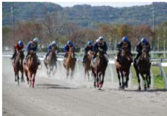
上級課程に進み訓練中